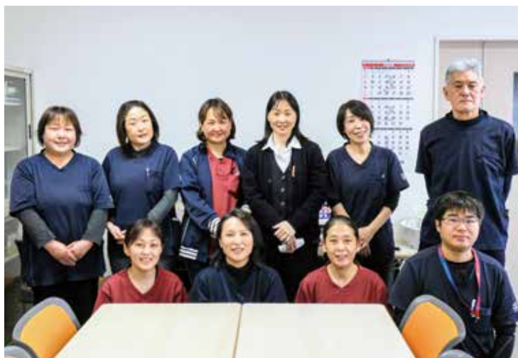
元気で明るい職場です。寒い日も暑い日も、スタッフ同士、お互いにフォローしながら業務を行なっています。